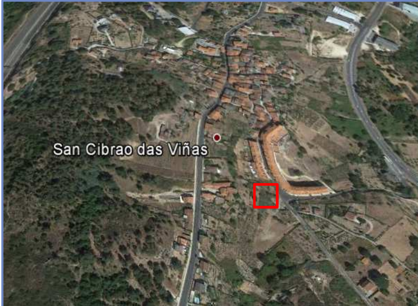
San Cibrao das Viñas

El contenido y fotografías de esta página es meramente informativo y no constituyen oferta firme, ni tienen valor contractual, siendo su contenido orientativo, por lo que el usuario queda obligado, a confirmar con ABANCA CORPORACIÓN, DIVISIÓN INMOBILIARIA, S.L., la situación a tiempo real de la información obtenida.